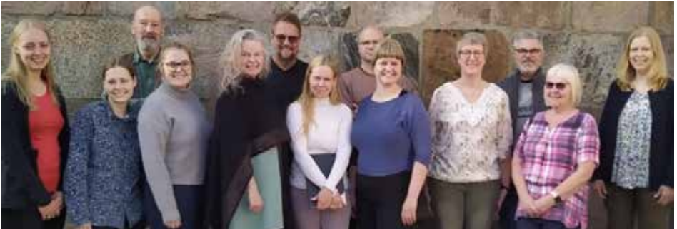
Efter musikgudstjenesten serveres en forfriskning i våbenhuset!