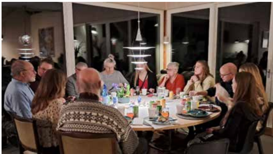
Julefrokosten 2023

Mange dejlige venskaber er udsprunget af fællesskabet omkring korsang, og vi hygger os rigtig godt sammen.