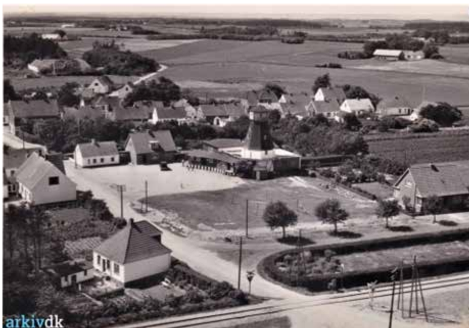
Foto - Vonge Mølle 1949