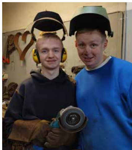
-Foto af unge mennesker på værkstedet

Vi håber du vil kigge ud forbi os på Tinnetaard, og tag gerne din familie og dine venner med til en