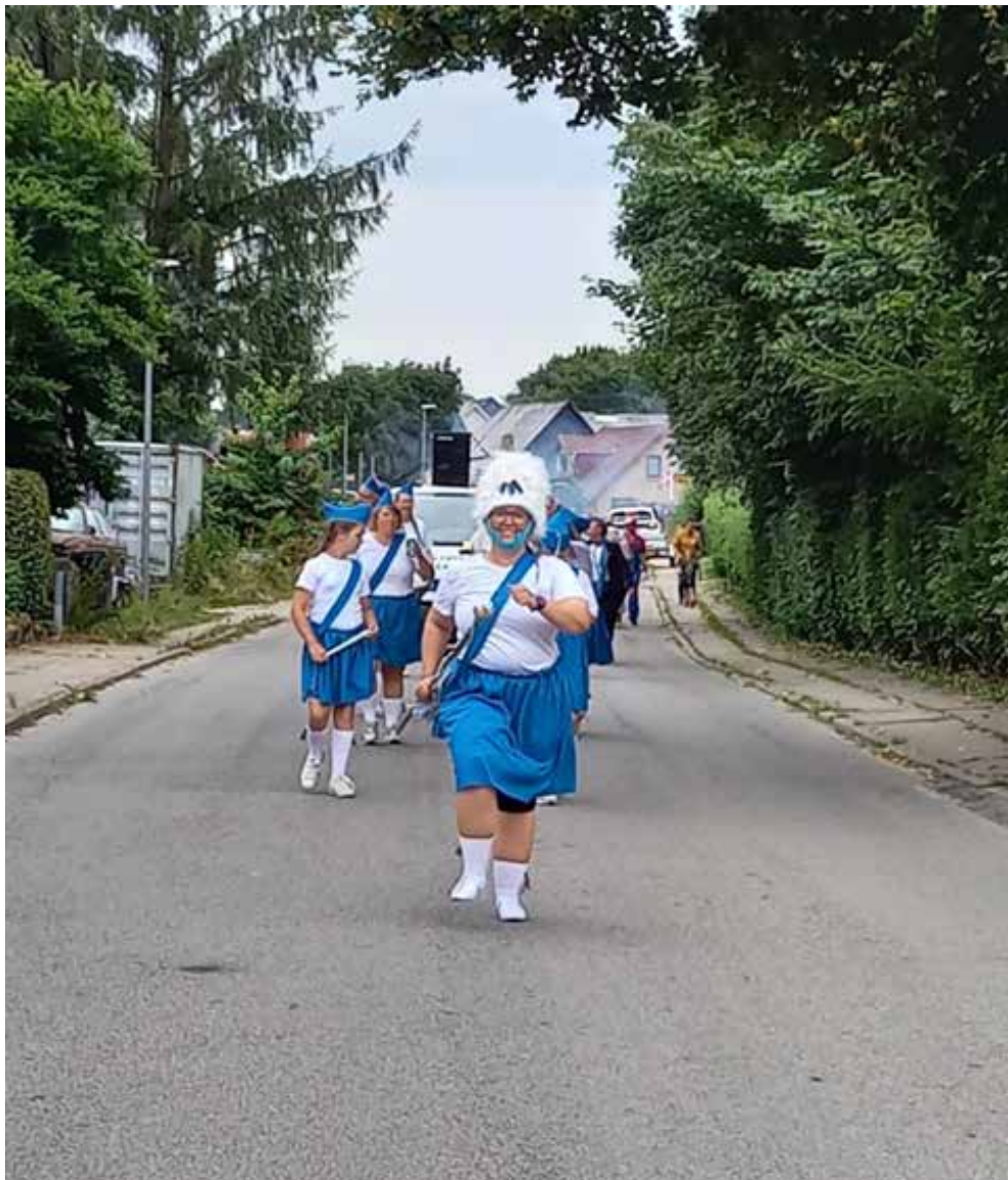
Foto og tekst af Keld Bøgelund Rising Nielsen pva. Sommerfestudvalget