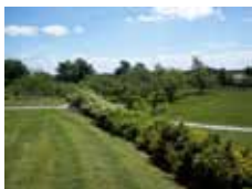
Bo i naturskønne omgivelser