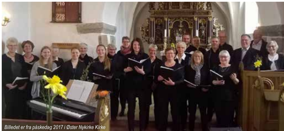
Billedet er fra påskedag 2017 i Øster Nykirke Kirke

Traditionen tro medvirker kirkekoret ved gudstjenesten påskedag, som i år finder sted i Vonge Kirke kl. 10.00. Koret synger med på fællessalmerne. Desuden synger koret introitus som optakt til gudstjenesten og en motet efter prædiken.