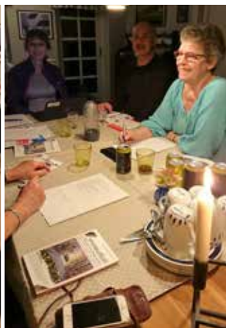
Bladmøde 21. januar 2020