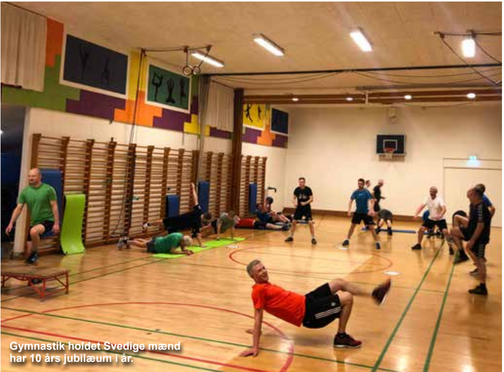
Gymnastik holdet Svedige mænd har 10 års jubilæum i år.