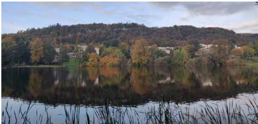
Kollegierne ligger på campus, på den modsatte side af Uni bygningerne (bibliotek, klasseværelser, kontorer osv.)

Jeg ville oprindeligt gerne studere i Frankrig, men det er jo ikke alle lande, der har et lige så gratis uddannelsessystem for studerende som Danmark, så jeg fandt en udvej. Universitets udgifter i Skotland bliver nemlig betalt