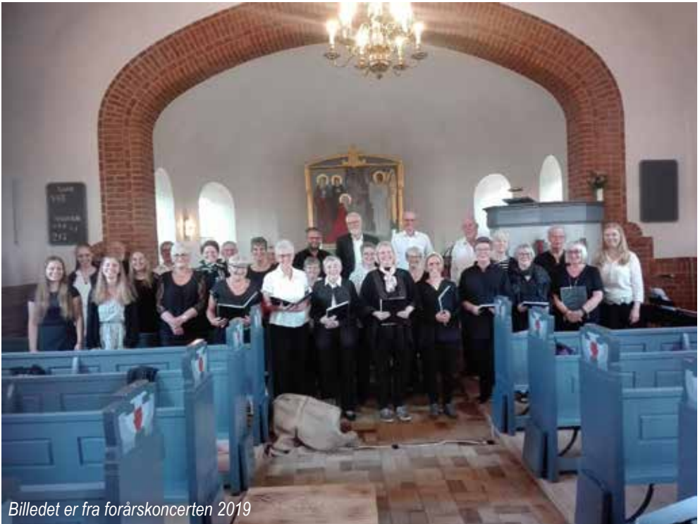
Billedet er fra forårskoncerten 2019

Sæt kryds i kalenderen allerede nu! Julekoncert med kirkekoret finder sted torsdag den 5. december kl. 19.30 i Øster Nykirke Kirke.