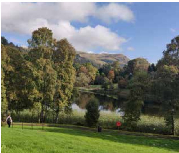
Udsigten fra skolebygningerne

Jeg har siden 1. kl. været aktiv spejder hos Vonge-Kolleporten Spejderne først som spejder og senere som leder. Derudover har jeg i mange år været springgymnast både i Vonge og på landsdelsholdet i Balle. Her i Stirling spiller jeg tennis to gange om ugen i stedet.