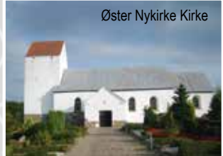
Øster Nykirke Kirke