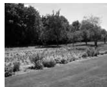
Grøntsager fra egen køkkenhave