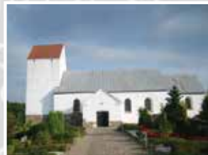
Øster Nykirke kirke