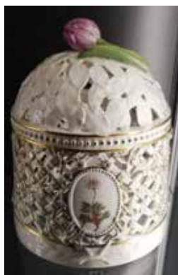
Floradania stellet - isspand