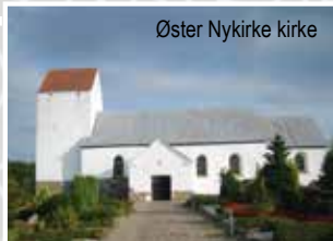
Øster Nykirke kirke