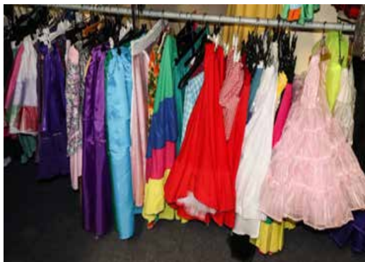
-Tekst af Lotus Wandall

Vi lejer ud, både til foreninger og til private. Man skal være medlem for at leje. Det koster 50 kr. pr år for privatpersoner og 100 kr. for institutioner. Til gengæld koster det meget lidt at leje kostumerne.