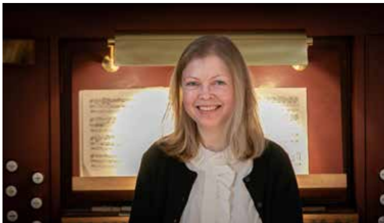
- Tekst Inge Hermann