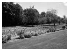
Grøntsager fra egen køkkenhave