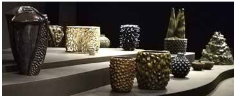
8 Salto udstillingen i skattekammeret - hvis man peger ind over kanten så hylér alarmen