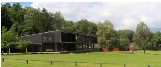
FDF Friluftscenter Sletten - Wikipedia, den frie encyklopædi

Torsdag 26. september kl. 8.00 – 15.00 har du mulighed for at blive frivillig og få en sjov dag med årets konfirmander.