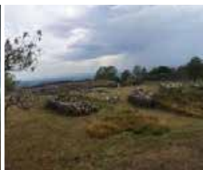
Rester af gammel romersk by.

Efter en god nats søvn, skulle vi gå 25 km til Palas de Rei, hvor vi igen skulle begynde med at gå opad, da de fleste byer for det meste ligger i dale. Men ellers en dag der ikke gik så meget op og ned, en dag der mere gik ad lange lige stykker vej og skovstier. Undervejs kom vi forbi en gammel romersk by, der lå på en bakketop, med en fantastisk udsigt