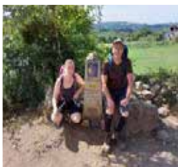
Her er vi ved 100km stenen.