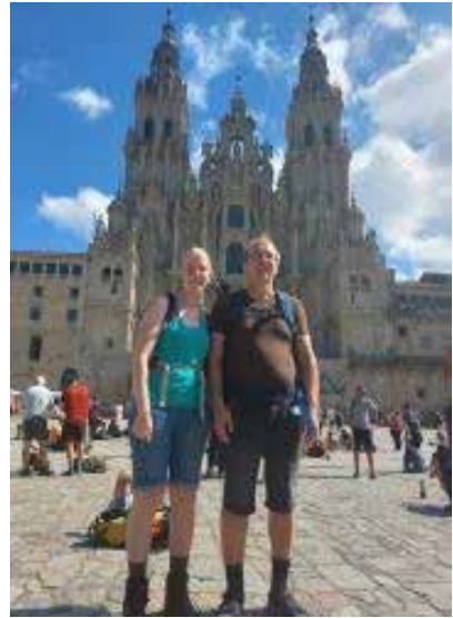
Udenfor katedralen i Santiago.

Da vi kom til Santiago, kunne vi gå ind på et pilgrimskontor og få et diplom på at vi havde gået de 114 km, som man skulle for få det og vi skulle have 2 stempler pr. dag for at få det. Det tog kun 2 ½ time for at få det, der er omkring 200.000 mennesker, der går