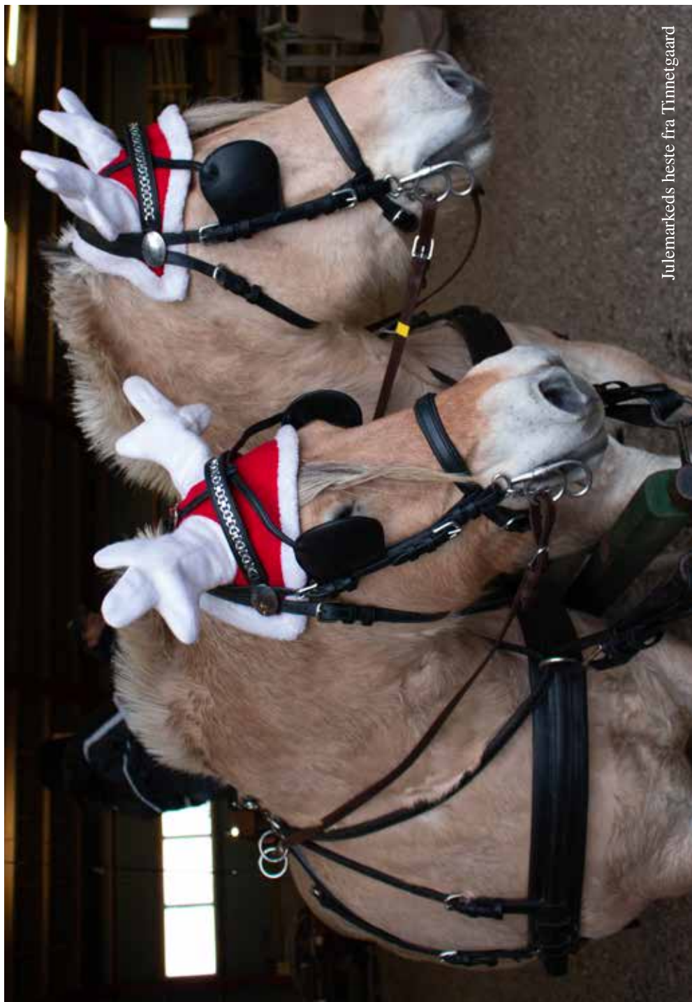
Julemarkeds heste fra Timmetgaard