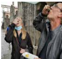
Østers smagning på marked i Santiago.