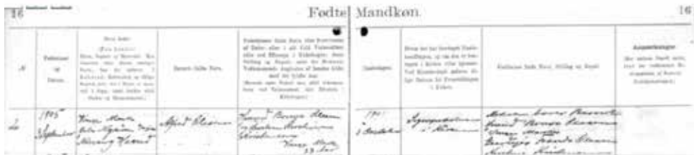
Billede (ikke så tydeligt), er fra kirkebogen, hvor min oldefar (morfars far) er noteret født.

Tilbage i 2013, oprettede jeg et online slægtstræ på en hjemmeside, hvor jeg plottede lidt navne og andet data ind. Herfra er det nærmest gået sin egen gang. Jeg kan huske, at jeg tilbage i folkeskolen havde fået til opgave, at lave et ane træ med mine forældre, bedsteforældre, oldeforældre og tip-oldeforældre. Her var jeg så "nødsaget" til at opsøge de "gamle" i familien, som kunne svare på en masse spørgsmål. Dengang var det ikke specielt spændende, men da jeg sad og lyttede til de mange familiehistorier blev min interesse virkelig vakt. Det var via disse små narrative interviews, at jeg virkelig fik øjnene op for slægten. Og her valgte jeg så at lukke mit online stamtræ op igen, efter nogle år, hvor den havde været sat fuldstændig på standby. Og, hvordan går man så i gang med sådan noget slægtsforskning? Først skulle