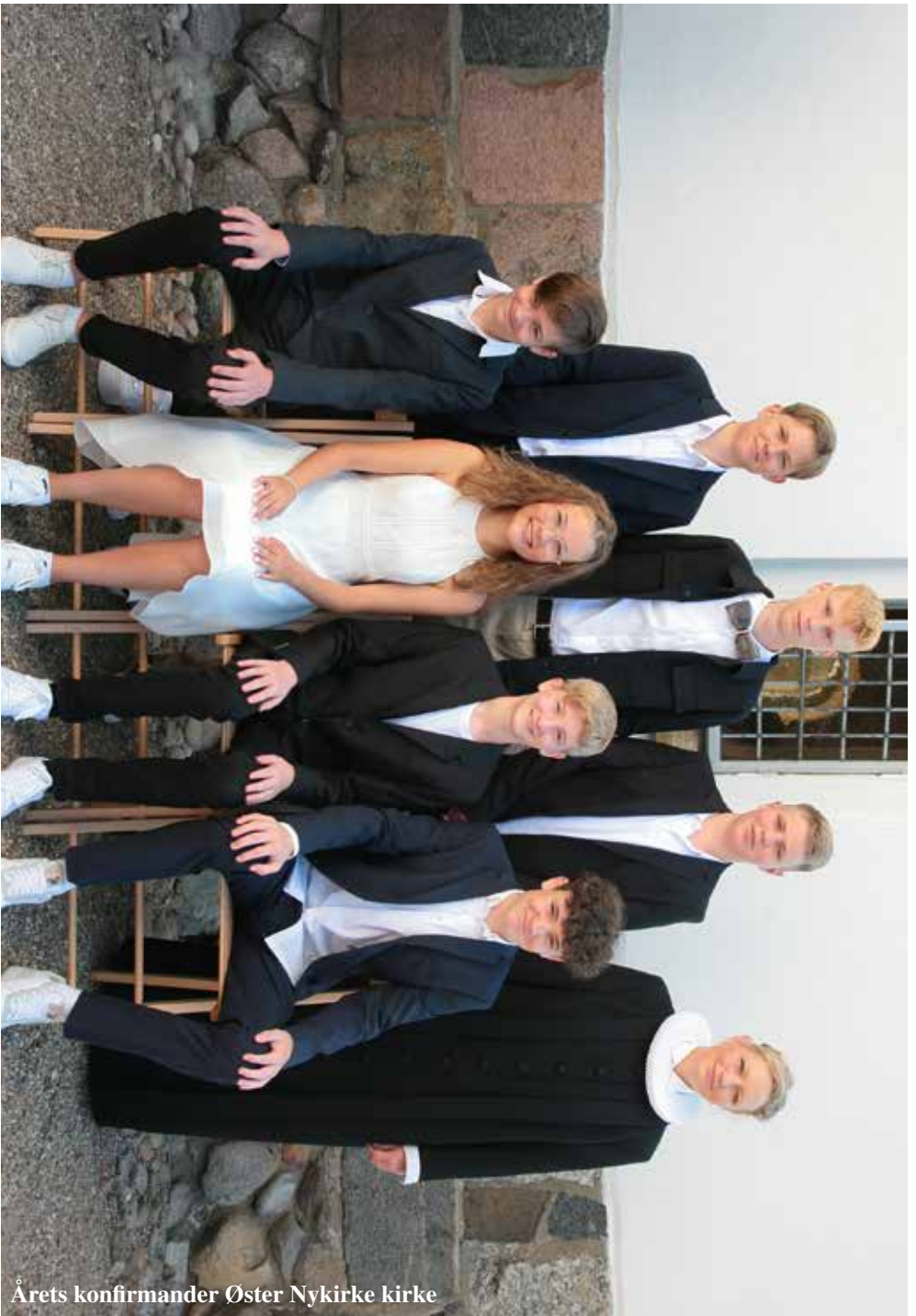
Årets konfirmander Øster Nykirke kirke