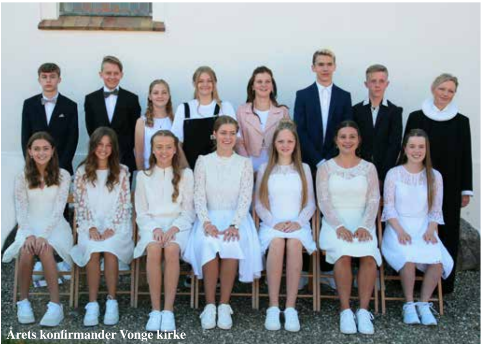
Årets konfirmander Vonge kirke